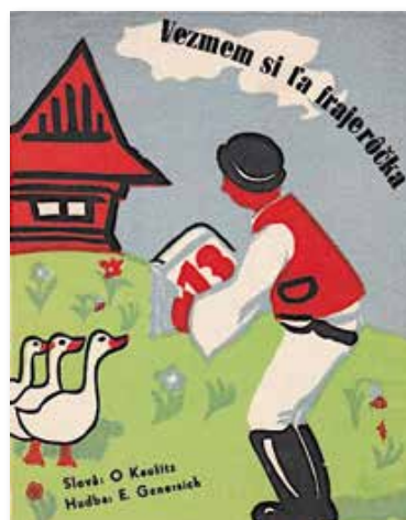
Genersichs Foxtrott dient fast 70 Jahre später als Filmmusik